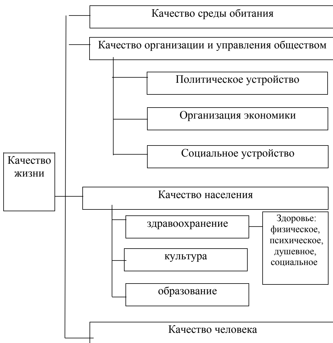
Рис.1 . Укрупненная схема структуры понятия «качество жизни»

Основными элементами качества жизни по А.Васильеву выступают: качество среды обитания, качество организации и управления обществом, качество населения и качество человека. При этом наибольшая проблема в практическом использовании данного подхода заключается в том, что в каждой стране свое представление о том какой уровень и какое соотношение входящих в его состав элементов сегодня признается как качественное.