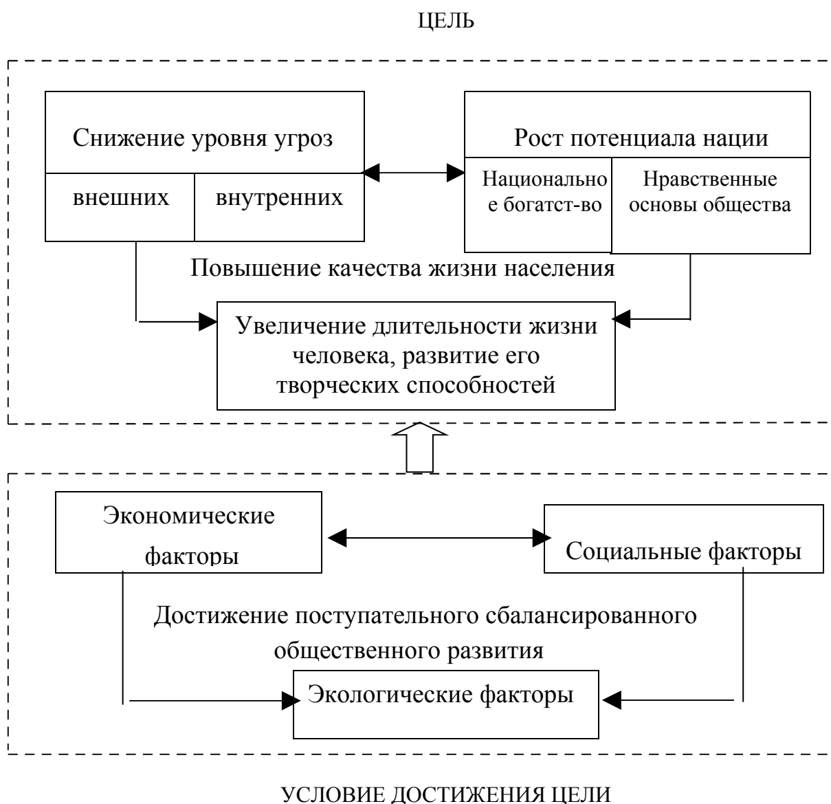
Рис.2. Условия роста качества жизни населения

и нравственные и культурные основы общества) и устойчивости его развития, достигаемых на основе поэтапного снижения внешних и внутренних угроз. Приближение к качественному состоянию системы достигается на основе повышения сбалансированности изменения всех факторов общественного развития (экономических, экологических и социальных), что сопровождается ростом длительности жизни человека, развитием его творческих способностей. Вот почему высокое качество управления рассматривается как залог жизненного успеха, высокого уровня жизни населения, здоровой экономики, экологического благополучия и достойного места в мировом сообществе (рис.2).