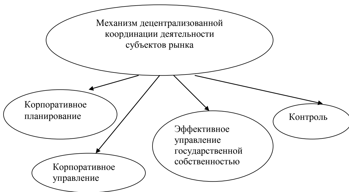
Рис. 3. Механизм децентрализованной координации деятельности субъектов рынка

На рис.3 представлен механизм децентрализованной координации деятельности субъектов рыночной экономики. Он включает корпоративное планирование, управление, эффективное управление государственной собственностью (доля государства) и контроль.