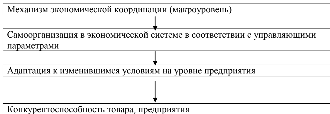
Рис. 1. Общий механизм экономической координации стран

Установление государством так называемых «правил игры» представляет собой механизм централизованной координации (регулирования) . Этот механизм определяется целью формирования социально ориентированной рыночной экономики в России и состоит в обеспечении эффективности общественного производства и его социальной направленности. Централизованная координация на национальном и региональном уровнях осуществляется при помощи специальных институтов, следящих за соблюдением механизма конкуренции как принципа координации деятельности субъектов рынка и осуществляющих борьбу с властью монополий на товарных рынках, т. е. осуществляющих регулирование (рис. 2).