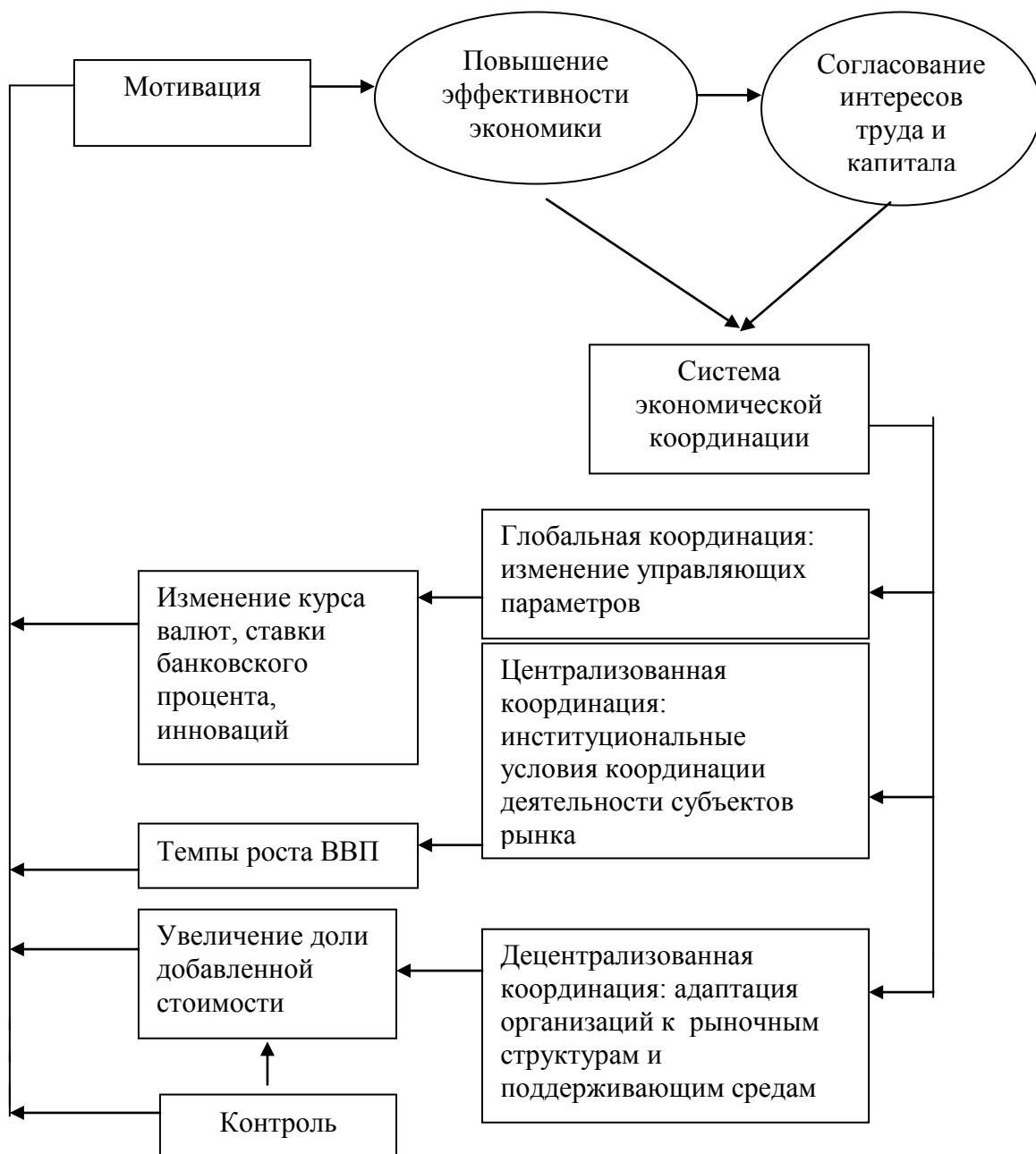
Рис. 4. Модель управления процессом формирования конкурентной среды в России.