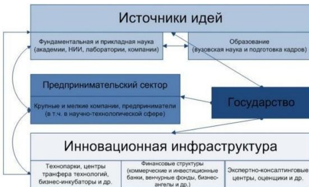
Рисунок 2. Структура ИИС